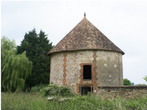
Le colombier circulaire