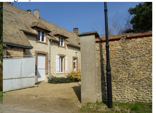
Moellons, briques et tuiles plates