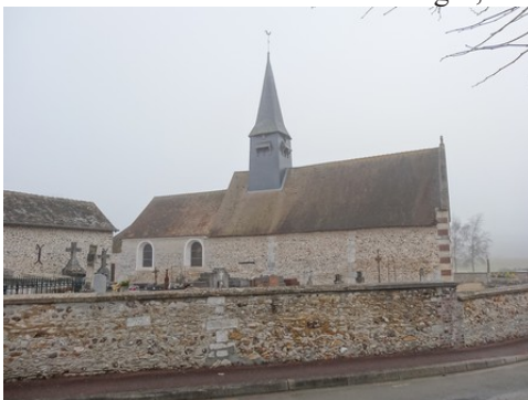
L'église du Plessis-Hébert

Les avis seront cohérents avec ceux émis ces dernières années, à savoir : pas de maisons à volume compliqué (type V, W, Y, ou Z), pentes à 45° pour les volumes principaux, ardoise ou tuile plate de teinte brun vieilli, à 20u/m 2 , avec un débord de toiture de 20cm, enduit de teinte beige clair avec modénatures (au choix : chaînages, encadrement de fenêtres, soubassement, colombage...). *Voir les autres fiches.